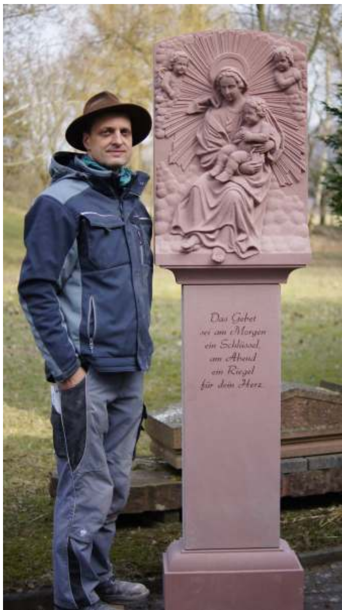
Bildstock frei nach einer historischen Vorlage