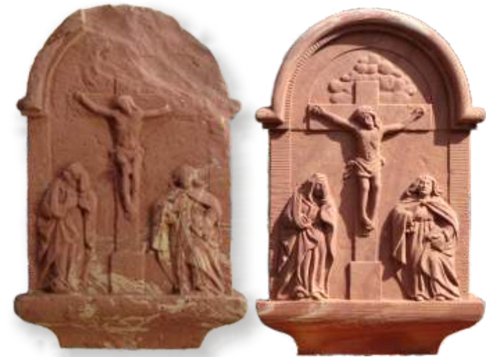
„Nonnenbild“, Dorfprozelten Original und Rekonstruktion.

Kopien von historischen Vorlagen, auch mit teilweisen Fehlstellen, stellen daher kein Problem dar.