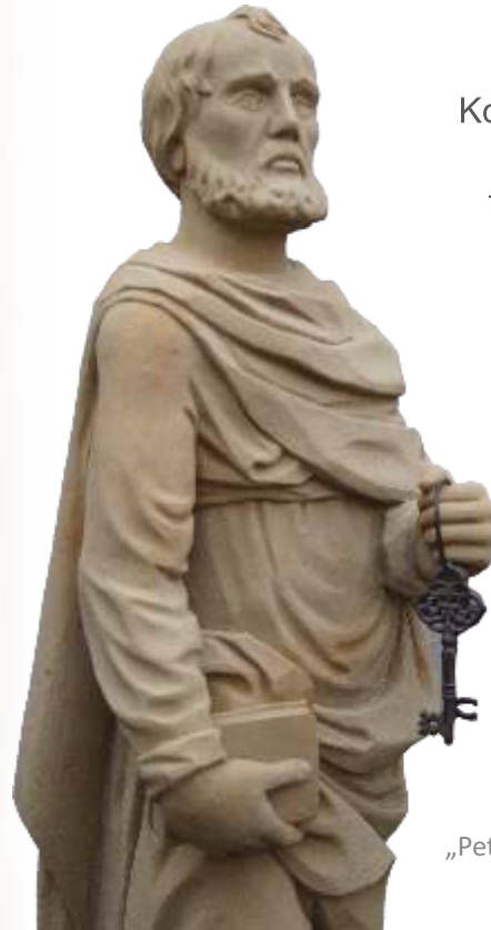
„Petrus“, Pfarrhaus Großheubach Neuanfertigung nach Vorlage

Unsere besondere Stärke liegt in der Neuanfertigung von lebensechten Figuren nach eigenen Modellen und Entwürfen.