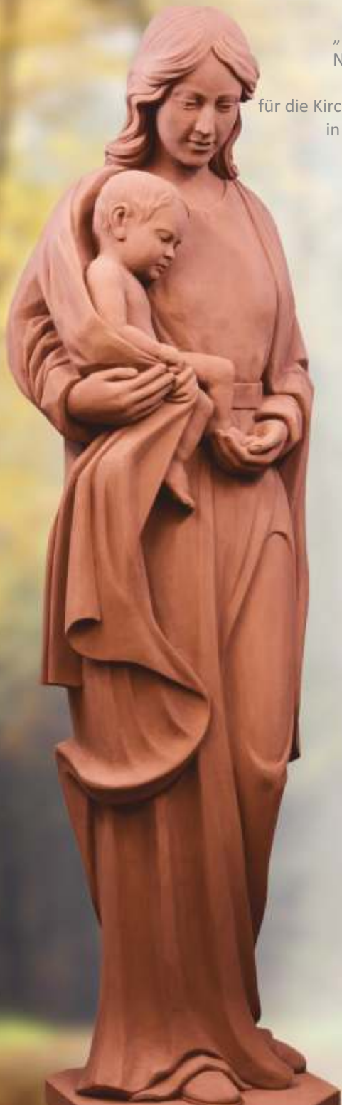
„Madonna mit Kind“, Neuanfertigung nach eigenem Entwurf für die Kirche „Mariae Geburt“ in Buttlar Thüringen. Höhe ca. 170 cm