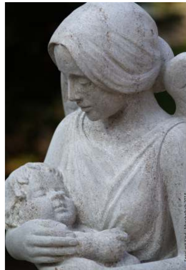
Engel mit Kind - Muschelkalk 2014