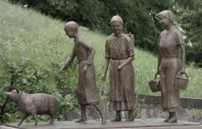
Wasserspiel mit Bronzefiguren in Blankenbach

Beispiele für profane Entwürfe mit Heimatbezug