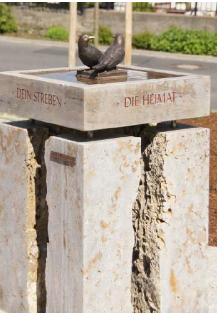
„Vogelbad mit Amselpaar“ Bronze und Muschelkalk, Waldbrunn bei Würzburg

Beispiele für profane Entwürfe mit Heimatbezug